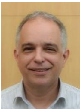
Analista de Sistemas, integrante da equipe multidisciplinar de suporte ao Jurídico do BNDES

Eu era do Escritório Corporativo de Projetos do BNDES e acompanhava de longe a jornada de transformação digital do jurídico do BNDES. Os resultados chamavam a atenção, se destacavam na quantidade e qualidade das entregas. Entendo que esta jornada pode inspirar outras áreas do Banco a enfrentar o desafio da transformação digital. Estes foram fatores decisivos para a minha decisão de me juntar a esta equipe. Atualmente trabalho em diversas frentes, como a internalização de novas ferramentas tecnológicas (vide “Road Map 2023” recente desenvolvido com tal foco) e metodológicas (InovaJur, Legal Design etc.), que vêm obtendo reconhecimento e premiações externas de destaque nacional.