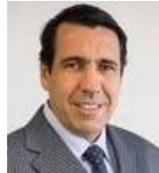
Administrador, gerente da equipe multidisciplinar de suporte ao Jurídico do BNDES

Trabalho como gestor desta equipe multidisciplinar de suporte ao jurídico deste 2018, quando, a partir de um processo de Planejamento Estratégico, desenvolvido com metodologia ágil e participativa (BSC2G), demos início a esta jornada de transformação digital, do jurídico, tendo sempre como premissas o seu alinhamento com a estratégia corporativa, o foco nos clientes, a consolidação do “jurídico viabilizador de negócios”, sua replicabilidade para o restante do Banco e a preocupação permanente com a implementação e internalização das melhores práticas de gestão da estratégia, de processos, de tecnologias, de informações e conhecimentos, de mudanças etc.