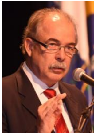
Presidente do BNDDES em seu discurso de posse

O Brasil precisa também se digitalizar. O próprio BNDDES irá fazer a sua transformação digital, como processo contínuo e permanente.