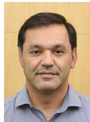
Chefe do Departamento Jurídico de Recuperação de Créditos do BNDES

A eficácia dos esforços para recuperação de créditos está diretamente relacionada ao nível de conhecimento que o credor tem de seu cliente e o domínio que detém de informações estratégicas para nortear a abordagem deste devedor. Neste sentido, a coleta e tratamento de dados relevantes para embasar sua atuação precisa ser uma obsessão dos departamentos jurídicos de recuperação de créditos, em razão da qual temos adotado diversas estratégias que têm sido transformadoras para a recuperação de créditos.